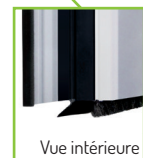
Joint bas sur ouvrant