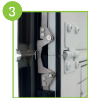
3 Tringlerie en inox en applique (sans câble)