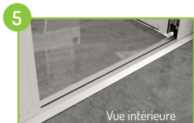
5 Seuil plat en aluminium (normes PMR) à rupture de pont thermique + 2 joints EPDM