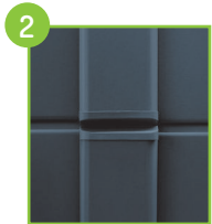
2 Profils d'encadrement en aluminium et bouchons anti-pincement de doigts