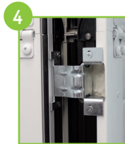
4 Paumelles réglables